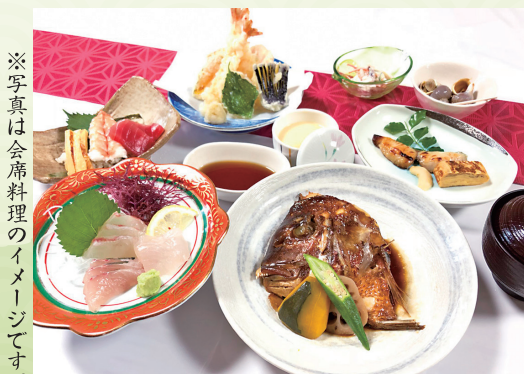
※写真は会席料理のイメージです。